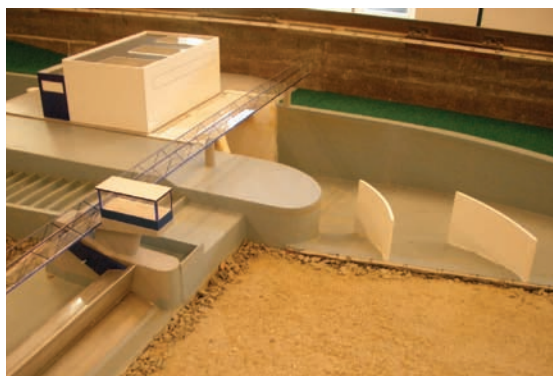
Detail fyzikálního modelu koryta Labe pro hydraulický výzkum nátoky.

Veškerá příprava je zajištěna nejen prostřednictvím odborných firem, jako je Pöyry Environment, a.s., ale také v úzké spolupráci s VUT Brno Fakultou stavební – laboratoří vodohospodářského výzkumu Ústavu vodních staveb a ČVUT Praha Katedrou hydrotechniky.