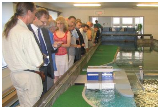
Prezentace fyzik. modelu pro partnery a odbornou veřejnost na VUT v Brně.