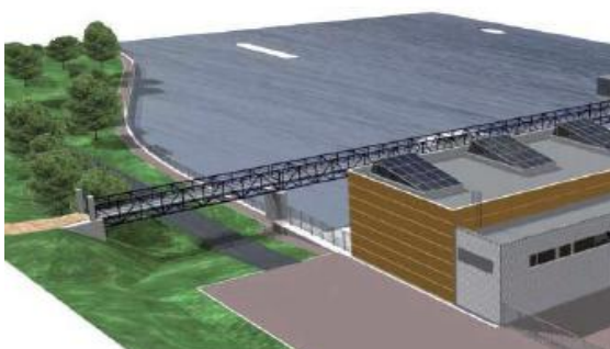
Vizualizace objektu MVE na pravé straně břehu

Projekt využívá zkušeností z realizací vodních elektráren při jezích na dolní Vltavě a Labi, a také poznatků získaných z povodní v srpnu 2002. Jedná se o instalaci ověřené technologie – dvě přímoproudé Kaplanovy turbíny v provedení PIT o průměru oběžného kola D 5,10 m s max. hltností obou turbín v souběhu 340 m 3 a celkovým výkonem – 5,2 MW; průměrná roční výroba je 31,5 GWh.