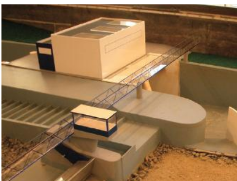
Detail fyzikálního modelu koryta Labe pro hydraulický výzkum nátoků.

Na přípravu a částečnou realizaci díla investor dosud vynaložil částku 39 mil. Kč. Dokončení rozpracované investice MVE Štětí bylo na počátku roku 2008 vysoutěženo za 720 mil. Kč (investor však veřejnou soutěž zrušil z důvodu v té době nezajištěného financování). Lze předpokládat, že cena dokončení projektu v rámci nového výběru dodavatele v roce 2010 nepřekročí částku 773 mil. Kč.