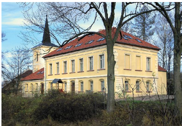
Hlavní budova respitní části komplexu dětského hospice

Zejména lepší péči v domácnosti by umožnila i existence regionálních poboček – zatím máme částečně fungující pobočku v Ostravě, výhledově by kromě posílení tohoto střediska bylo výhodné zřídit také středisko v Brně a Plzni.