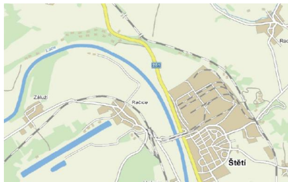
Lokace MVE Štětí.

Projekt „Malá vodní elektrárna Štětí“ (dále jen MVE Štětí) představuje optimální využití hydroenergetického potenciálu profilu stávajícího jezu Štětí–Račice na dolním toku Labe, a to při zachování příznivého poměru mezi celkovými investičními náklady a množstvím vyrobené energie, a dále s přihlédnutím k možnosti přímých dotací a ke skutečnosti dotovaných výkupních cen dle Zákona č. 180/2005 Sb. o podpoře výroby elektřiny z obnovitelných zdrojů energie.