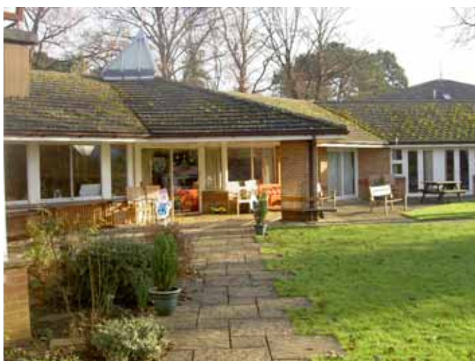
FOTO ZE STUDIJNÍ CESTY PO DĚTSKÝCH HOSPICÍCH - HELEN AND DOUGLAS HOUSE V OXFORDU, VELKÁ BRITÁNIE

Ve dnech 10. – 20. prosince 2005 se zástupcům Nadačnického fondu Klíček a společnosti Energeia, za vydatné podpory Britského velvyslanectví v Praze, podařilo uskutečnit dlouho plánovanou studijní cestu po vybraných britských dětských hospicích. Cesty se zúčastnil šestičlenný tým, připravující podklady pro prováděcí dokumentaci druhého objektu dětského hospice v Malejovicích (ošetrovatelské jednotky) – členy týmu byli dva lékaři, dvě zdravotní sestry, maminka, která se svým dítětem zažila neúspěšný konec onkologické léčby v nemocnici a je již deset let aktivní spolupracovnicí Nadačnického fondu Klíček, a dobrovolník-herní specialista. Účelem cesty bylo jednak seznámit se s různými modely dětské hospicové péče, jednak probrat se zástupci jednotlivých zařízení ošetrovatelské a technicko-provozní otázky související s naším projektem. Studijní cesta vedla přes Kinderhospiz Balthasar v německém Olpe, hospic Demelza House v Kentu, Helen House v Oxfordu, Acorn's ve Worcesteru, Horizon House v Belfastu a St. Oswald's v Newcastleu. Výstupem desetidenní exkurze byla nejen detailní zpráva z cesty, doplněná bohatou foto- a videodokumentací, ale také příslib profesionální pomoci a spolupráce ze strany všech navštívených hospicových domů.