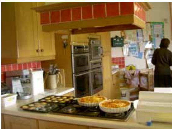
DOMÁCKÉ PROSTŘEDÍ V HELEN AND DOUGLAS HOUSE V OXFORDU, VELKÁ BRITÁNIE

S původním rozhodnutím o zřízení střediska a kanceláře v Brně bylo spojeno zakoupení kancelářské a výpočetní techniky v rozsahu: notebook s trvalým mobilním připojením na internet a potřebným software, tiskárna, scanner a mobilní telefon s novým číslem a tarifem. Toto vybavení bylo po zrušení střediska v lednu 2006 přesunuto do dětského hospice v Malejovicích a dáno k dispozici novému zaměstnanci společnosti Energeia, který bude mít za úkol koordinaci příprav stavby ošetrovatelské jednotky.