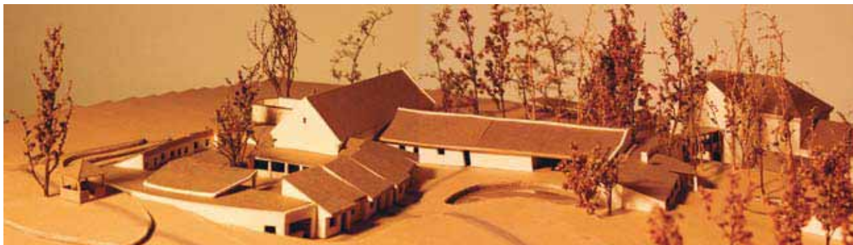
Model projektu novostavby ošetrovatelské jednotky dětského hospice

Byla pouze zahájena konzultační spolupráce s Nadačním fondem Klíček – viz www.klicek.org ve věci výběru projektu novostavby ošetrovatelské jednotky dětského hospice v Malejovicích u Uhlířských Janovic na Kutnohorsku.