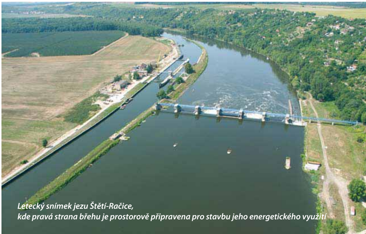
Letecký snímek jezu Štětí-Račice, kde pravá strana břehu je prostorově připravena pro stavbu jeho energetického využití

První obnovitelný zdroj energie, tedy zároveň i trvale obnovitelný zdroj finančních prostředků k financování obecně prospěšných činností bude vybudován na dolním toku Labe, na stávajícím jezu Štětí-Račice, který dosud není energeticky využit.